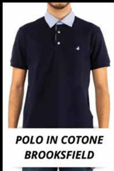
POLO IN COTONE BROOKSFIELD

TI ASPETTIAMO IN NEGOZIO PER GUIDARTI NELLO SHOPPING, OPPURE VISITA IL NOSTRO SITO, WWW.NEWLORENS.IT PER PRENOTARE LA TUA ORA DI SHOPPING ESCLUSIVA.