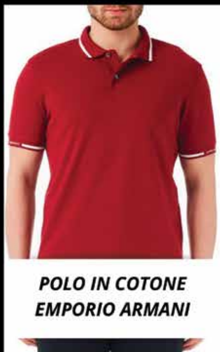
POLO IN COTONE EMPORIO ARMANI