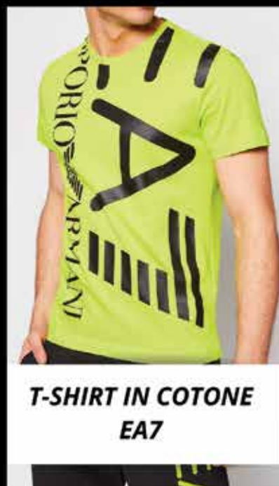
T-SHIRT IN COTONE EA7

TI ASPETTIAMO IN NEGOZIO PER GUIDARTI NELLO SHOPPING, OPPURE VISITA IL NOSTRO SITO, WWW.NEWLORENS.IT PER PRENOTARE LA TUA ORA DI SHOPPING ESCLUSIVA.