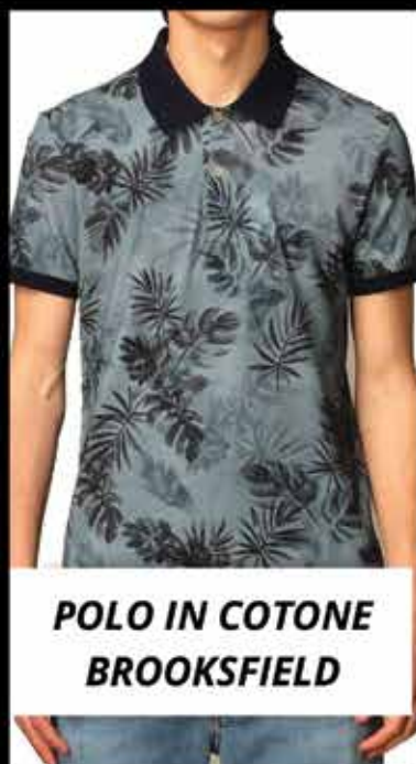
POLO IN COTONE BROOKSFIELD