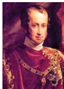
Ritratto di Ferdinando I d'Austria

Domenica 15 febbraio 1846 venne solennemente inaugurato il tratto della ferrovia Milano-Treviglio, con unica fermata intermedia la stazione di Melzo.