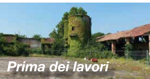
Prima dei lavori