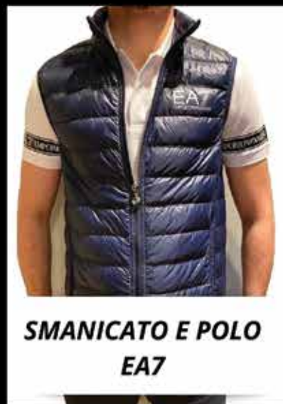
SMANICATO E POLO EA7