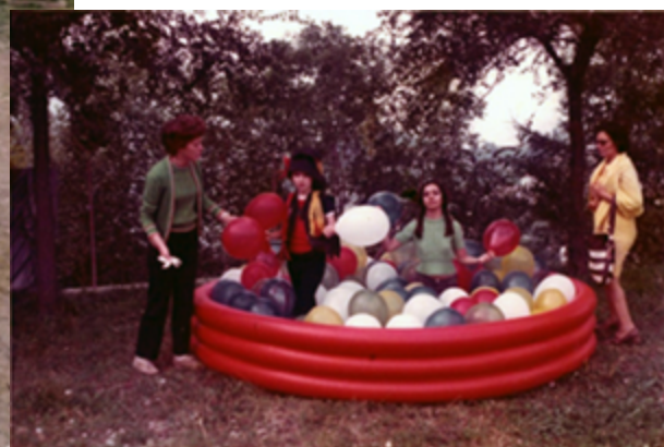
Fotografie dei progetti pilota d'avanguardia ENI. Settembre 1973 e settembre 1974