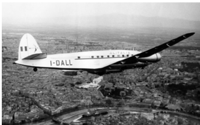
1954 - Viaggio di andata per New York in aereo

ricerca della C.I.S.L. provinciale di Milano nel proprio archivio storico, si sono potute leggere le 11 pagine della relazione di quel viaggio. Il viaggio è durato 2 mesi, dal 24 ottobre al 19 dicembre 1954. La relazione descrive: le impressioni sul viaggio di andata Roma-New York con aereo L.A.I. (Linee Aeree Italiane); le impressioni generali dal punto di vista sociale, religioso; la composizione geografica e politica del Governo federale; le impressioni generali sulle città visitate, dove prevalentemente sono state visitate aziende e fabbriche: New York, Annapolis, Washington, Knoxville (visitato il museo della bomba atomica, dighe chiuse e aperte per energia elettrica), Durham, Cleveland, Detroit, Buffalo, Providence, compresa la visione panoramica delle spettacolari cascate del Niagara. Il viaggio di ritorno è stato effettuato in nave dal 19 dicembre 1954, in quanto l'aereo L.A.I., che avrebbe dovuto riportarli in Italia, fu distrutto in un incidente nell'aeroporto di New-York il giorno 18 dicembre 1954 (26 morti).