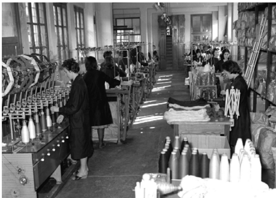
Una fase di lavorazione alla "Creazioni Laura"

dove è impegnata sindacalmente nella C.I.S.L. e come tale è coraggiosamente attiva quale componente della Commissione interna (attuale R.S.U. = Rappresentanza Sindacale Unitaria). La situazione dell'epoca era di grande conflittualità e molto difficile per gli attivisti sindacali. A Melzo la lotta sindacale dei lattiero-caseari era accanita. Per il rinnovo dei contratti nazionali, i lavoratori lattiero-caseari, arrivavano da tutta Italia a manifestare a Melzo. Ad esempio il prezzo del latte e i contratti di lavoro per i dipendenti dell'industria lattiero-casearia venivano definiti a Melzo fra Galbani e Invernizzi ed avevano valore per l'intero territorio Italiano.