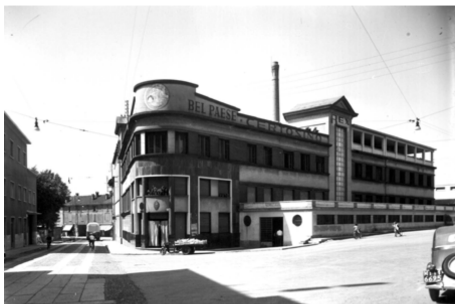
Società Egidio Galbani di Melzo: edificio storico

dove è impegnata sindacalmente nella C.I.S.L. e come tale è coraggiosamente attiva quale componente della Commissione interna (attuale R.S.U. = Rappresentanza Sindacale Unitaria). La situazione dell'epoca era di grande conflittualità e molto difficile per gli attivisti sindacali. A Melzo la lotta sindacale dei lattiero-caseari era accanita. Per il rinnovo dei contratti nazionali, i lavoratori lattiero-caseari, arrivavano da tutta Italia a manifestare a Melzo. Ad esempio il prezzo del latte e i contratti di lavoro per i dipendenti dell'industria lattiero-casearia venivano definiti a Melzo fra Galbani e Invernizzi ed avevano valore per l'intero territorio Italiano.