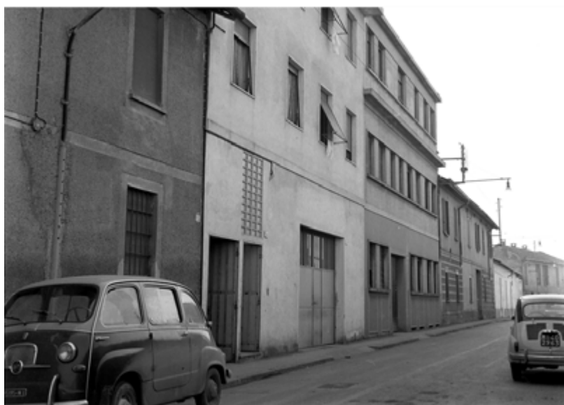
La sede delle "Creazioni Laura" a Melzo in via Mazzini