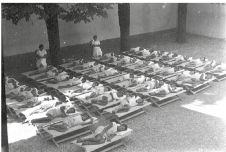
Colonie elioterapiche per la prevenzione della Tubercolosi organizzate dalla sezione dispensariale antitubercolare con sede a Melzo in via Maffia

Erano tempi difficili della ricostruzione dopo la seconda guerra mondiale. L'analfabetismo era ancora molto diffuso, così come erano molto diffuse alcune malattie: bronchiti, tubercolosi (TBC), poliomielite (vaccinazione obbligatoria dal 1966), ecc. Il vaiolo combattuto con la vaccinazione dal 1934 al 1977.