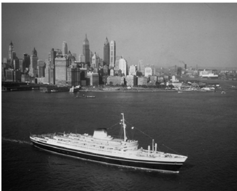
1954 - Viaggio di ritorno da New York via nave