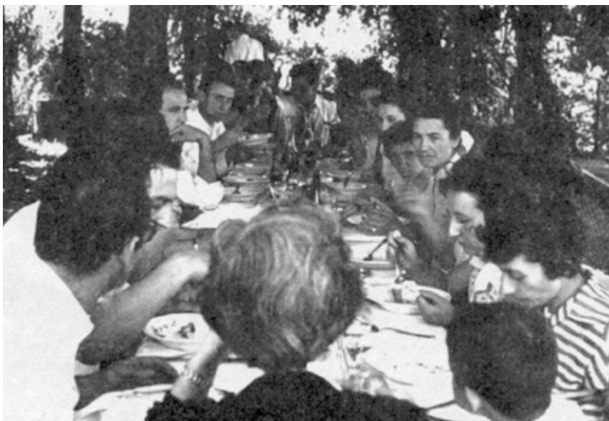
La pausa pranzo durante un corso di formazione

(Da Melzo Notizie, Periodico bimestrale della città, a cura dell'Amministrazione Comunale, n. 1, febbraio 1993)