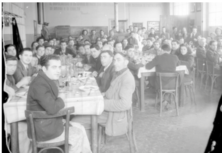
Immagine della mensa aziendale Galbani (anni 1940-45 ca.)