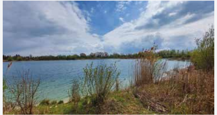
Oasi della Martesana – la cava