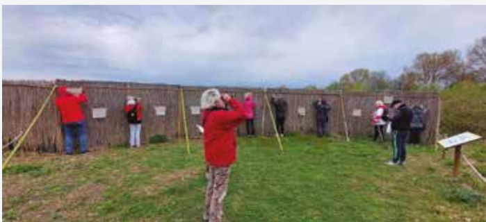
Birdwatching – Oasi della Martesana

Qualche curiosità... questa manifestazione deve il suo nome al percorso che i pastori facevano fare alle proprie greggi durante il periodo della transumanza primaverile verso le montagne circostanti. Infatti, la marcia si svolge, pur con qualche modifica naturalmente dovuta all'ampliamento delle strade, sullo stesso primo tratto della zona Martesana. Proprio per questo si cammina e corre in parte su asfalto ed in parte su strade sterrate.