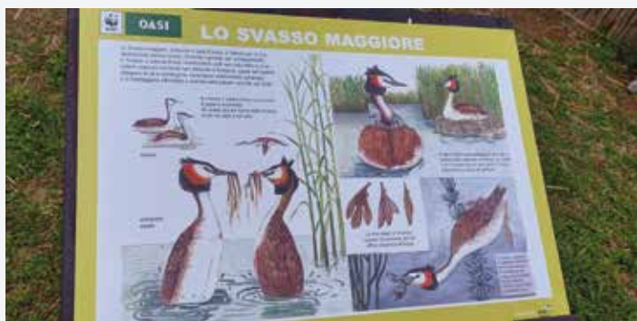
Oasi della Martesana – habitat e specie di uccelli