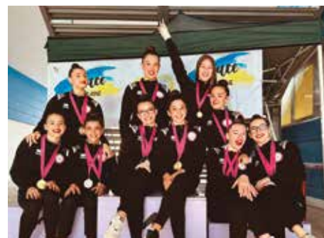
Le nostre ragazze, vittoriose ai campionati individuali e di serie D 2023

Prima però non dobbiamo e non dovete dimenticarvi del nostro grande sag-