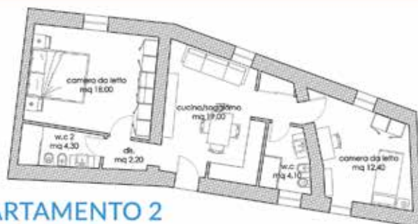
APPARTAMENTO 2 Trilocale mq 60