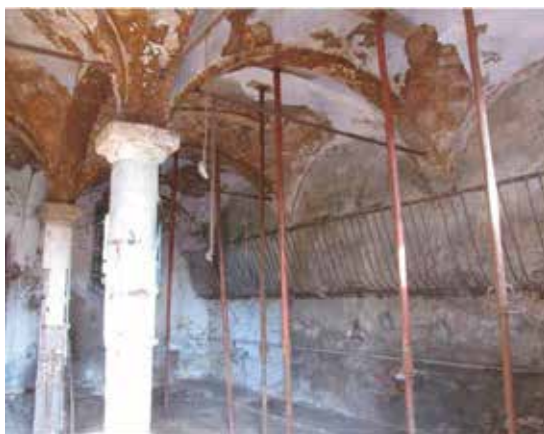
Cascina Triulza - Stalla animali minori

In un primo tempo l'intervento faceva parte delle opere "a fare" cioè doveva essere realizzata direttamente dall'impresa Pizzarotti che si era aggiudicata l'appalto TEM, senza una gara d'appalto specifica, quindi con tempi di esecuzione ridotti. Poi, per una serie di colpevoli ritardi e dopo aver corso il rischio di perdere il finanziamento, l'intervento della Triulza è rientrato nelle opere "a pagare", cioè TEM avrebbe pagato l'intervento che però è rientrato fra quelli per cui l'amministrazione comunale avrebbe dovuto avviare la fase finale di progettazione, la verifica del progetto e poi la gara d'appalto.