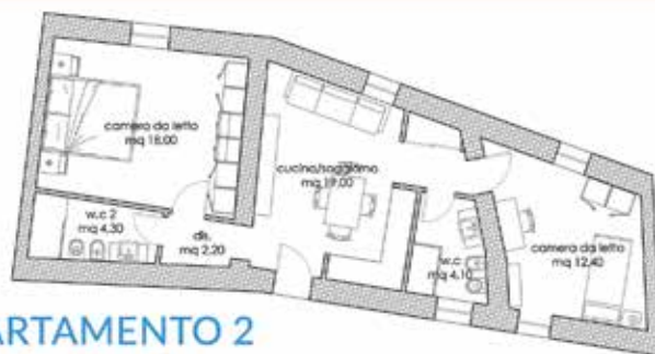
APPARTAMENTO 2 Trilocale mq 60