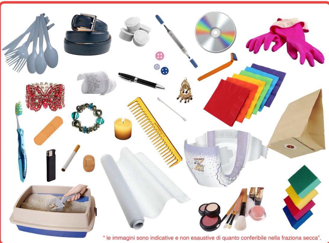
* le immagini sono indicative e non esaustive di quanto conferibile nella frazione secca*.